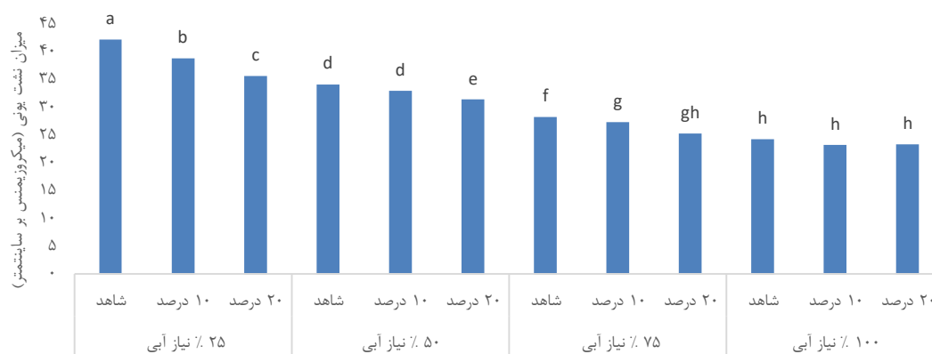
شکل ۲: مقایسه میانگین برهم‌کنش سطوح مختلف محلول پاشی متانول در تنش کم آبیاری برای صفت میزان نشت یونی رنگ‌ریزه های کلروفیلی

تیمار شاهد برخوردار بود. در این زمینه حامد و همکاران (۱۳۹۳) در بررسی بر روی ژنوتیپ‌های کلزا نشان دادند با افزایش فشار تنش خشکی بر روی گیاه شدت نشت الکترولیت‌ها نیز افزایش می‌یابد البته این افزایش بر حسب رقم می‌تواند متفاوت باشد. به نظر می‌رسد تنش خشکی با کاهش میزان تولید آسمولیت‌ها و در نتیجه تخریب غشاء بذور تولید شده بر اثر تجزیه توسط رادیکال‌های آزاد منجر به کاهش مقاومت پوسته در برابر تراوش متابولیت‌ها و در نتیجه افزایش میزان نشت یونی می‌شود که محلول پاشی متانول با فراهم آوردن CO 2 مورد نیاز جهت ادامه فتوسنتز و تولید مواد و آسمیلاسیون مواد با پیشگیری از فرایند تولید ROS و نیز پیشگیری از تخریب غشاء منجر به افزایش مقاومت پوسته در برابر تراوش متابولیت‌ها می‌شود.