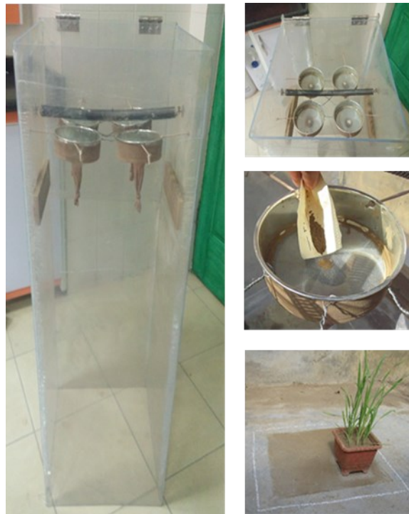
شکل ۱: اتاقک گرد و خاک مورد استفاده در مطالعه و نمایی از توزیع گرد و خاک توسط آن

گلدان‌ها در گلخانه شیشه‌ای قرار گرفتند و در طول شب، چراغ‌های آن خاموش نگهداشته شدند. گلدان‌ها هفته‌ای یکبار به‌طور یکنواخت و برابر آبیاری شدند. در طول آزمایش، دما و رطوبت نسبی هوای درون گلخانه به ترتیب بین ۱۸ تا ۲۷ درجه سانتی‌گراد و ۳۵ تا ۵۴ درصد اندازه‌گیری شد. روش تهیه گرد و خاک بدین صورت بود که نمونه‌ای از همان خاک بستر کشت آسیاب و الک (مش ۲۰۰) شد. ذرات خاک بدست آمده که قطری کم‌تر از ۷۵ میکرون داشتند به مدت ۲۴ ساعت در دمای ۸۰ درجه سانتی‌گراد درون آن خشک و تا زمان استفاده درون ظرف درب بسته‌ای نگهداری شد. تیمارهای گرد و خاک با کمک اتاقک گرد و خاک ساز (شکل ۱) که قبلاً طراحی و ساخته شده بود (علی‌وردی و کرمی، ۱۳۹۹) اعمال شد. در شکل ۱، تصویری از یکنواختی اعمال گرد و خاک روی سطح زمین و گیاهان ارائه شده است. پس از قرار دادن گلدان‌ها درون این اتاقک، گرد و خاک تهیه شده بر روی آن‌ها توزیع گردید.